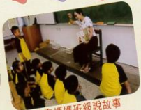
故事媽媽班級說故事