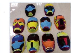
5年級創意面具彩繪