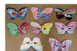
1年級創意面具彩繪