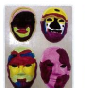
3年級創意面具彩繪