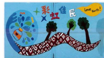
師生愛地球創意牆面彩繪