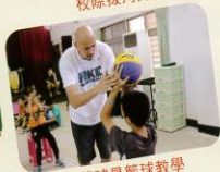
職籃球星籃球教學