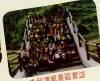
吉利潘風景區賞遊