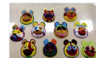
6年級創意面具彩繪