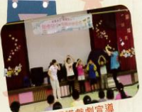
兒少保護戲劇宣導