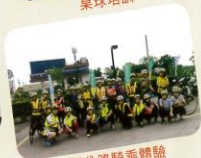
鐵馬公路騎乘體驗