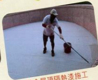
校舍屋頂隔熱漆施工