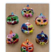
2年級創意面具彩繪