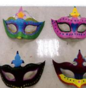
4年級創意面具彩繪