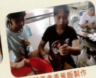
傳統美食香蕉飯製作