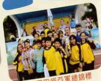
鄉運田徑亞軍總錦標