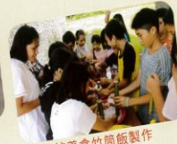
傳統美食竹筒飯製作